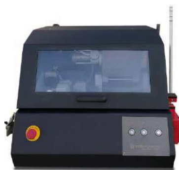
Multicut Easy Plus