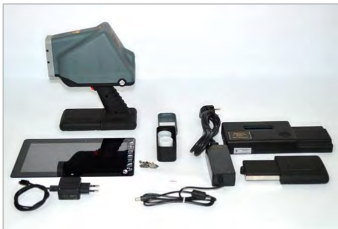
Комплект ПРФА «МетЭксперт»