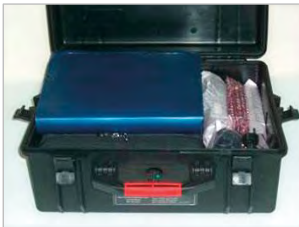
Тара для транспортировки — герметичный ударопрочный кейс